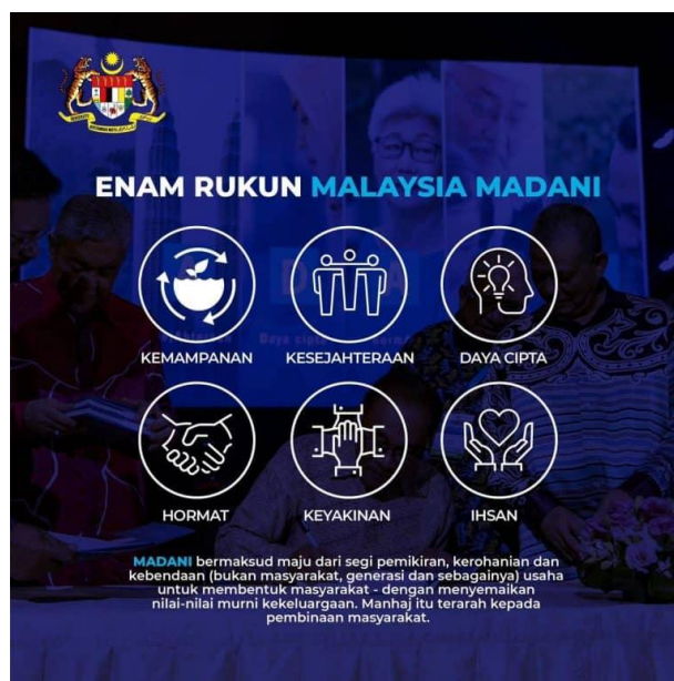
Gambar Rajah 1: Enam Rukun Malaysia Madani

Dalam amanat tersebut, Perdana Menteri turut menggariskan enam rukun teras Malaysia Madani seperti yang digambarkan dalam gambar rajah di bawah.