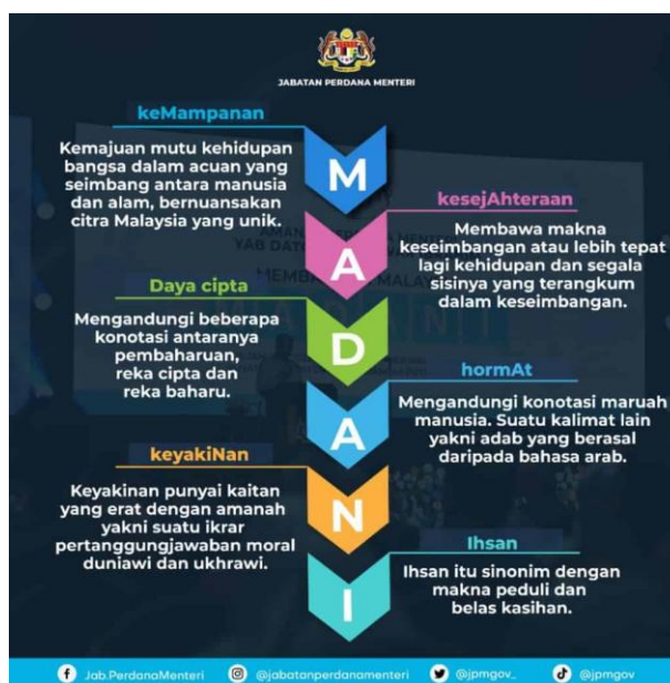
Gambar Rajah 2: Definisi Enam Rukun Malaysia Madani

bersepadu dan menyeluruh serta berorientasikan masa hadapan bagi membangunkan masyarakat madani yang progresif, berdaya saing dan inklusif.